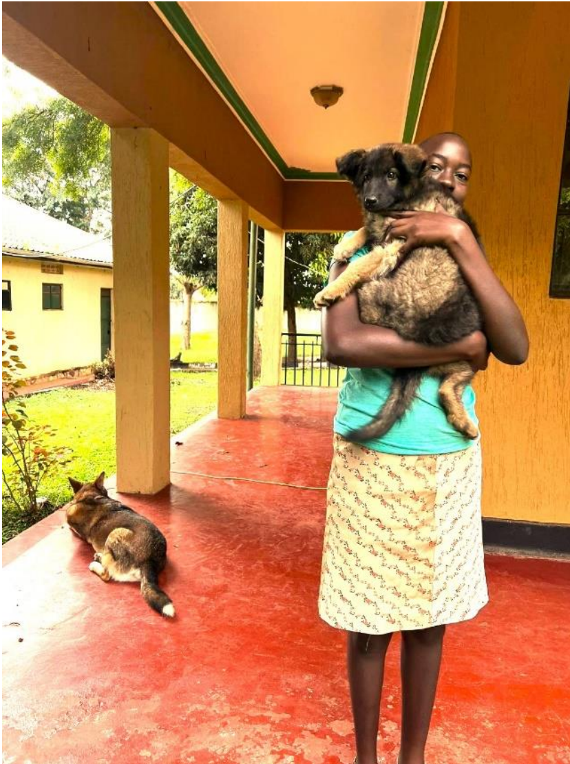
Finah met haar honden.