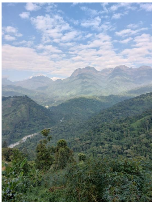
Uitzicht vanaf de berg

De jongelui gingen o.l.v. 2 gidsen de eerste dag wandelen door het bos en bij de rivier, de tweede dag werd een berg beklommen.