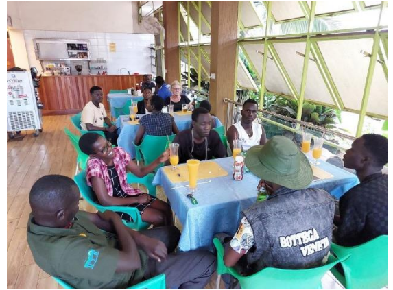
Op de terugweg hebben we nog heerlijk gegeten in het Buffalo Hotel in Hoima.