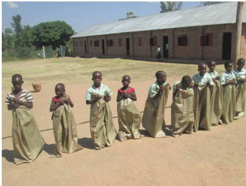
Zaklopen tijdens de fun day.